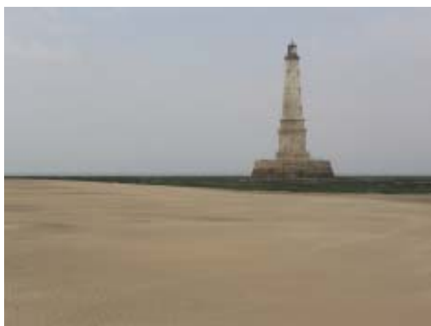
Le phare de Cordouan merveille de l'estuaire de la Gironde