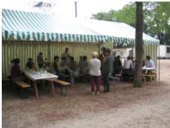
Sous tente pour se protéger des intempéries

Voici des photos de celui de l'an passé :