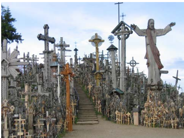
La colline aux Croix

N'ayant pas participé à toutes les étapes les Beauchampoises, excepté Olivier, ne figurent pas dans le classement final, mais nous sommes tous ravis d'avoir découvert de nouveaux terrains.