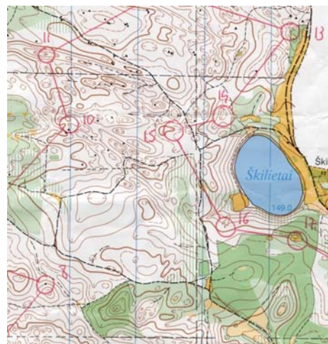
Extrait de la carte Le trou du Diable en Lituanie