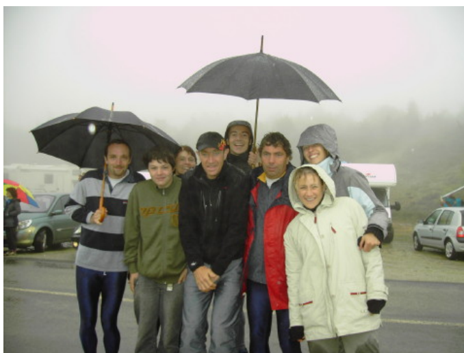
Photo souvenir sous la pluie avant le retour

Ces championnats se terminent un peu trop rapidement, mais nous sommes je pense tous satisfaits d'avoir couru sur ces cartes très techniques.