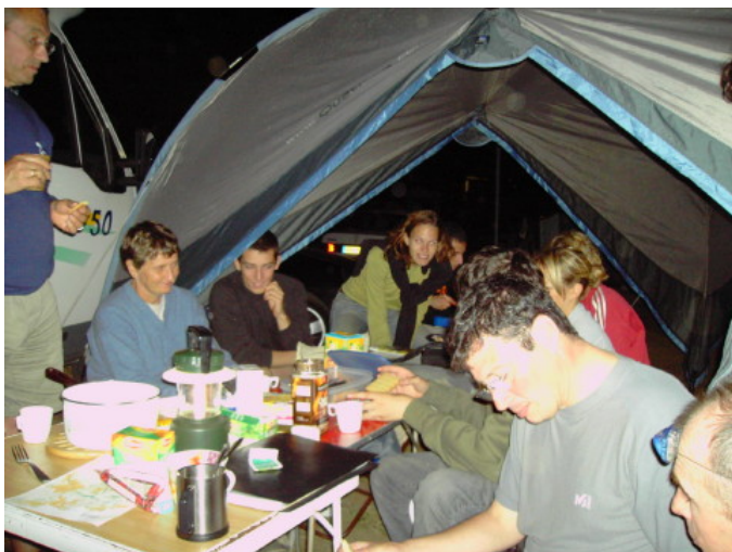
A table, tous ensemble les Beauchampois...

Installés au camping de St Julien Molin-Molette qui était rempli à rabords d'orienteurs, nous avons passé une petite semaine très conviviale et très enrichissante techniquement.