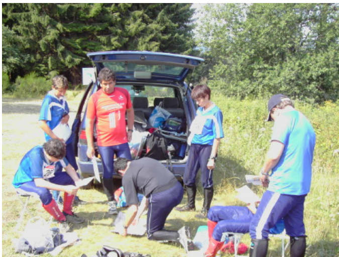
Préparation avant l'entraînement

Le second jour nous avons fait un entraînement puis